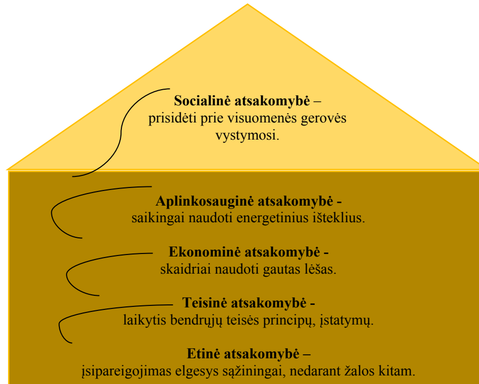
1 pav. VSPC socialinės atsakomybės samprata

Visagino socialinių paslaugų centro (toliau – VSPC) socialinė atsakomybė – tai VSPC atsakomybė dėl daromos įtakos visuomenei, siekiant išspręsti Visagino savivaldybės socialines problemas ir prisidėti prie visuomenės gerovės vystymosi.